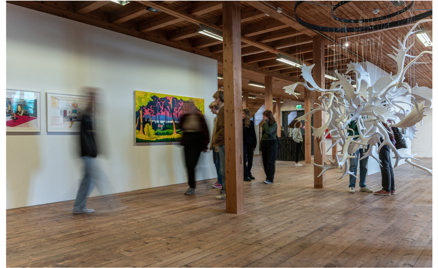
Corona-samlingen. Foto: Marcel Köppe.

– En så stor och aktiv konsthall som Havremagasinet bidrar verkligen till Bodens attraktivitet. Kulturen är en stor del i känslan av att leva ett rikt liv, och då gäller det också för att samhälle att ha ett brett och varierat kulturutbud, och det är här som en institution som Havremagasinet blir så viktig. Den som vill se samtidskonst behöver kort sagt inte köpa flygbiljett till Barcelona.