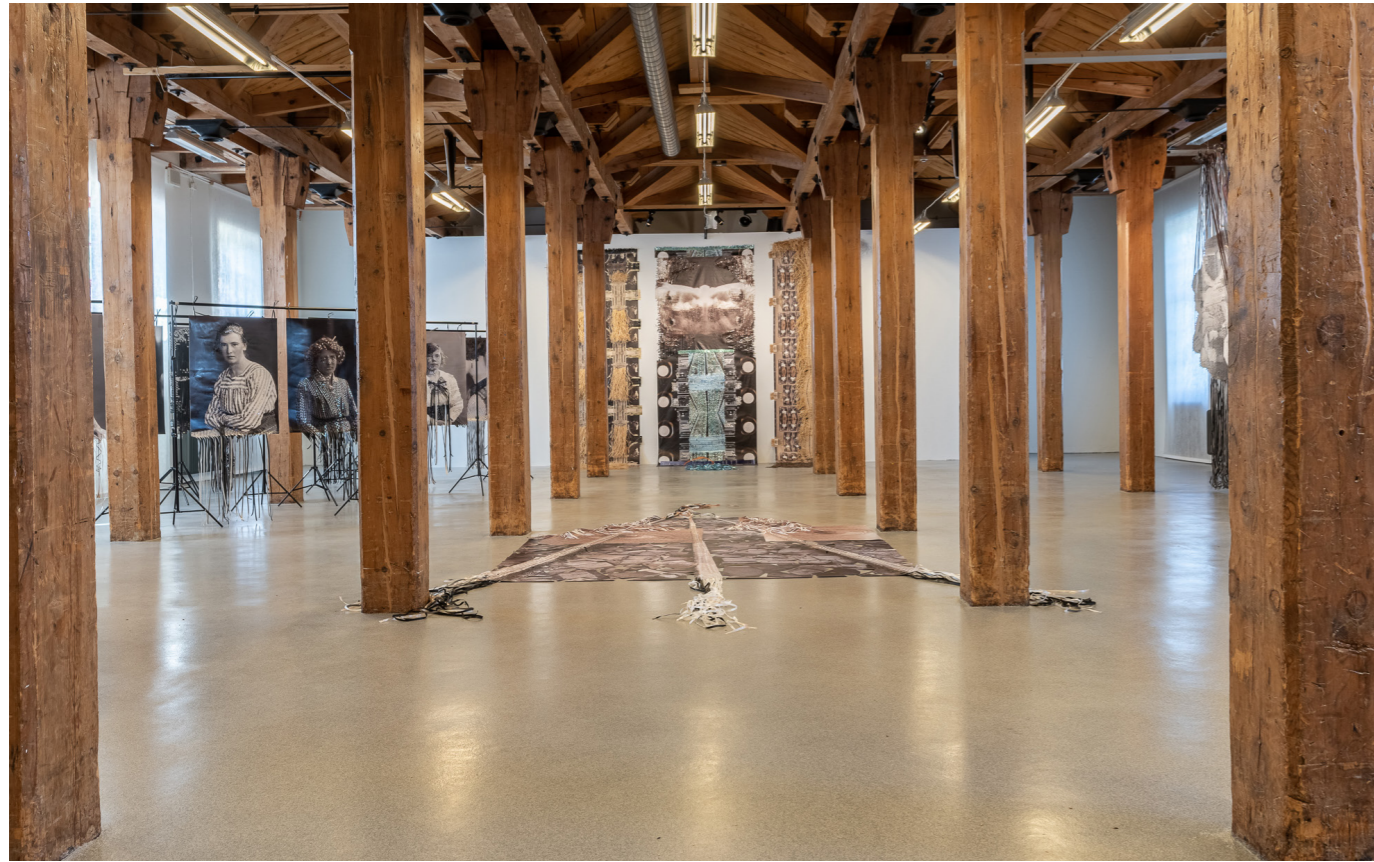
Från Kristina Müntzings utställning Aliasing.