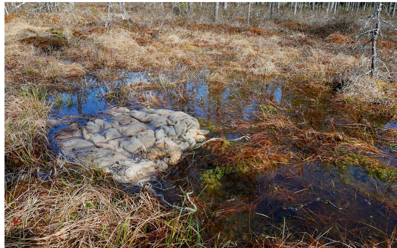
Torven på myren kan skapa mönster i den våta väven.

– Den lukten är som en smocka om man kommer nära. Jag använder skvattram att färga med, och ibland har jag provat att väva in den.