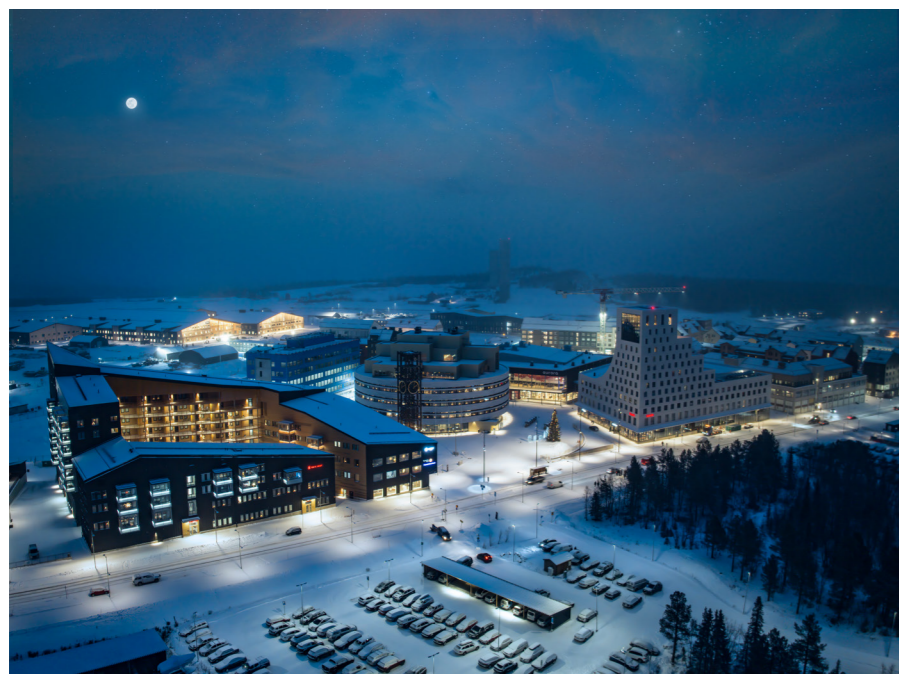
Kirunas nya stadskärna.

Varje år utser EU två städer till kulturhuvudstäder, ett initiativ som startade 1985. Städerna får möjlighet att både visa upp och utveckla sitt kulturliv inom projektet. För Sverige har Stockholm 1998 och Umeå 2014 haft titeln Europeisk kulturhuvudstad. 2029 står det mellan Kiruna och Uppsala, samt en stad i Polen. Vinnande städer meddelas i september 2024.