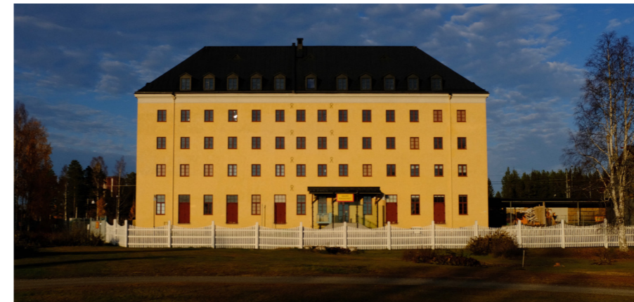
Havremagasinet ritades av arkitekten Erik Josephson och stod färdigt 1913.

Boden har den senaste tiden ofta syns ofta i medierna på grund av den väldiga